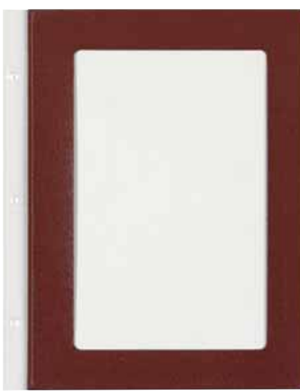
T/Carton plastifié papier A5