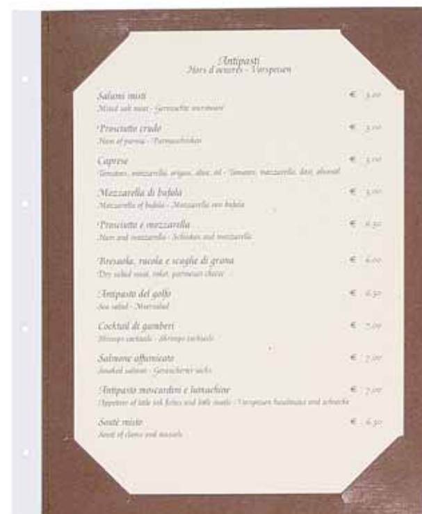
T/Carton plastifié papier A4