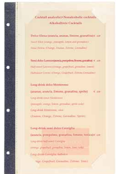
T/Carton plastifié papier cm. 15 x 29,7