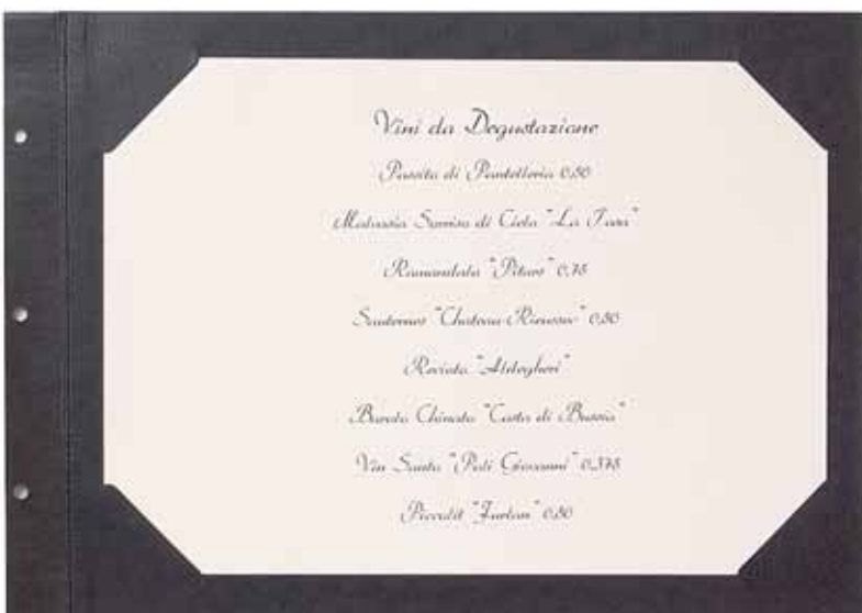
T/Carton plastifié papier A4