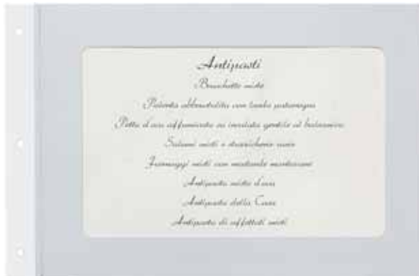
T/Carton plastifié papier A5