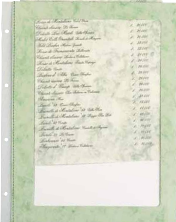
T/Carton plastifié papier A4