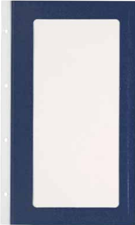
T/Carton plastifié papier cm. 15 x 29,7