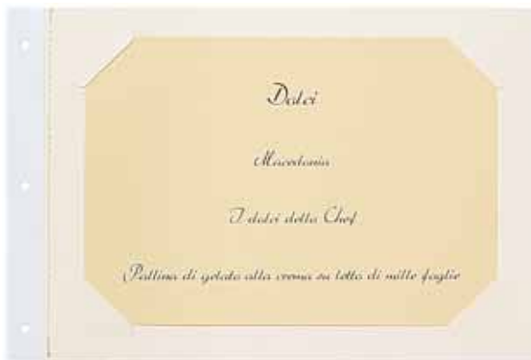
T/Carton plastifié papier A5