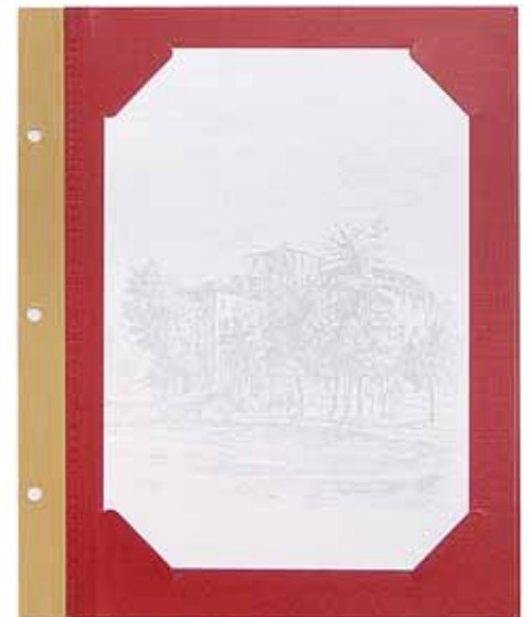
T/Carton plastifié papier A5