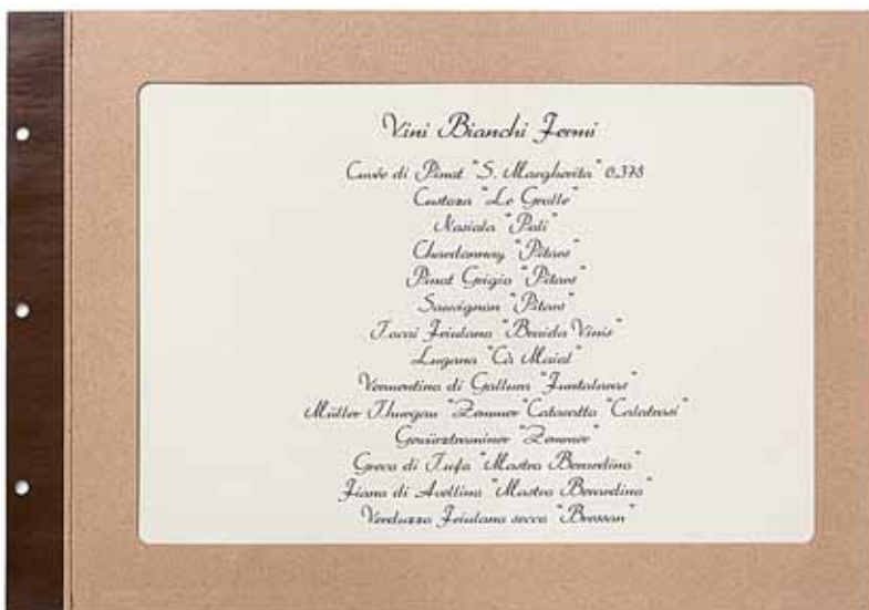
T/Carton plastifié papier A4