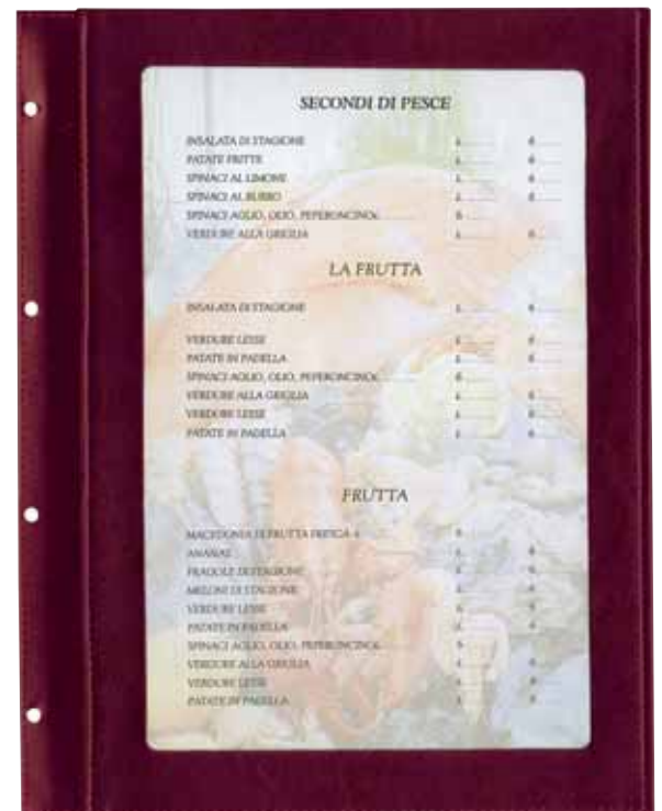
S/Simili cuir papier A4