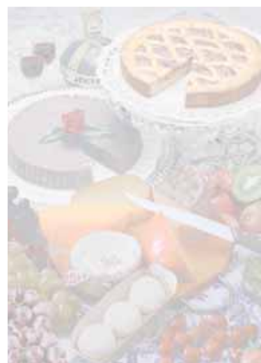
DF dolci e frutta