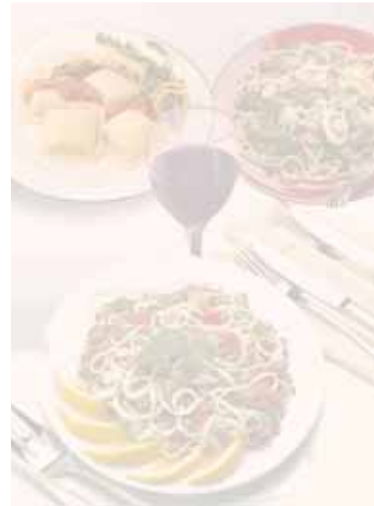
PT primi tradizionali