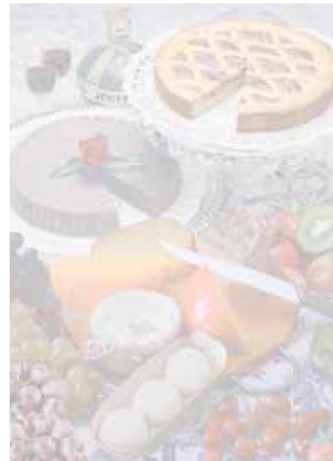
DF dolci e frutta