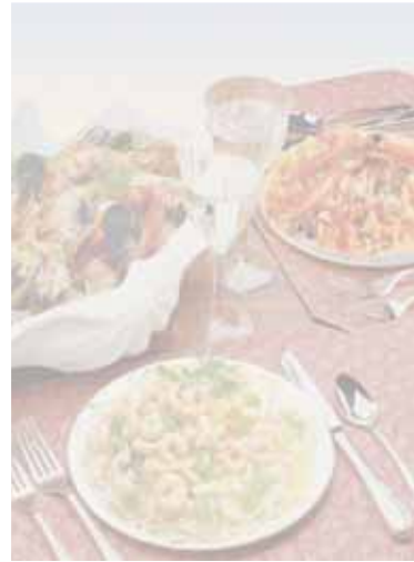
PM primi di mare