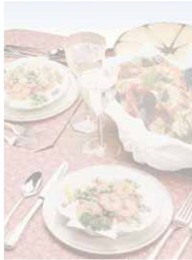
AM antipasti di mare