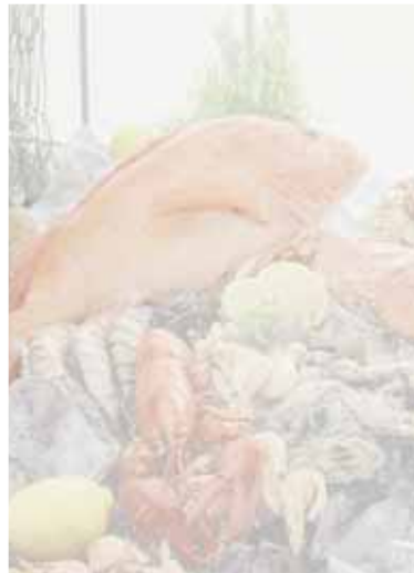
SM secondi di mare