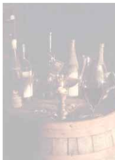
V2 la cantina