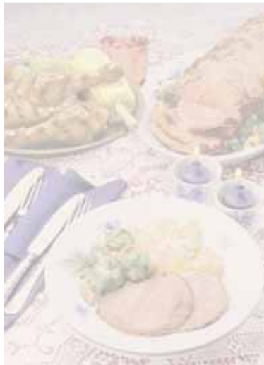
ST secondi tradizionali