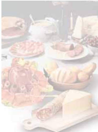
AT antipasti tradizionali