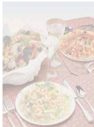
PM primi di mare