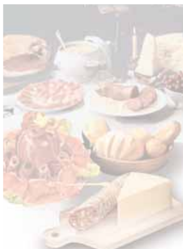
AT antipasti tradizionali