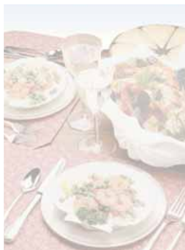
AM antipasti di mare