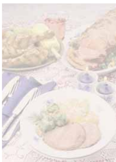
ST secondi tradizionali