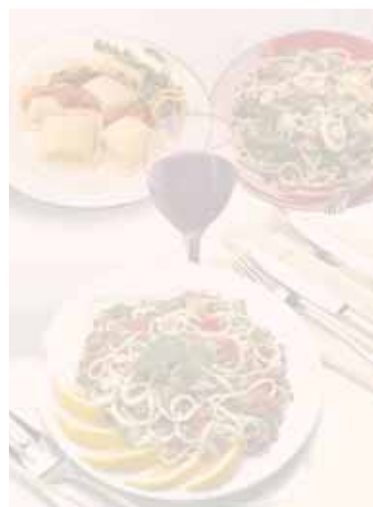
PT primi tradizionali