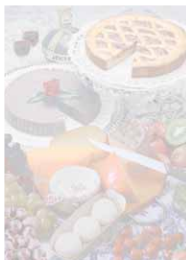
DF dolci e frutta