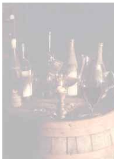
V2 la cantina