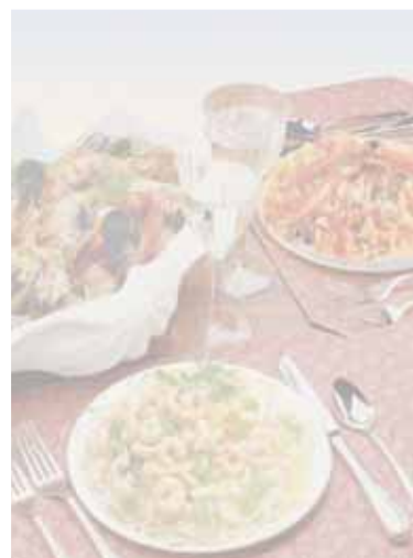
PM primidi mare