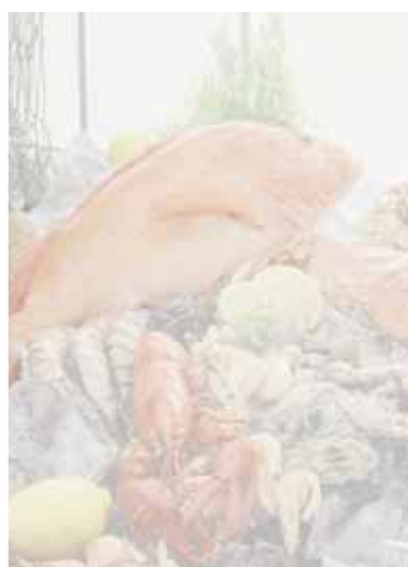
SM secondi di mare