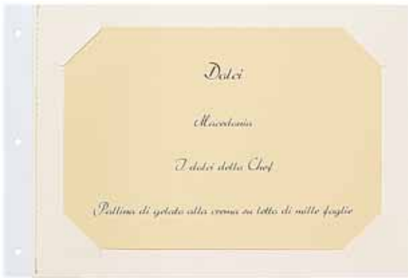
T/cartoncino carta A5

in verticale o orizzontale a finestra o ad angoli per la Serie: 8500-8800-8900