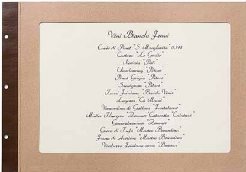
T/cartoncino carta A4