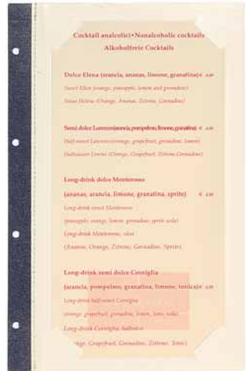
T/cartoncino carta cm. 15 x 29,7