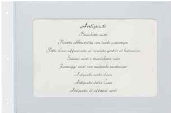
T/cartoncino carta A5