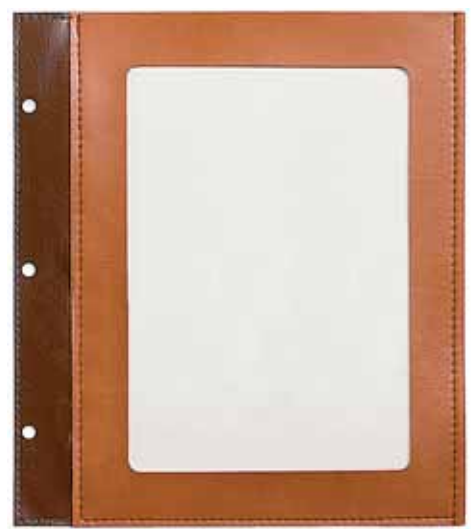
S/sepelle carta A5