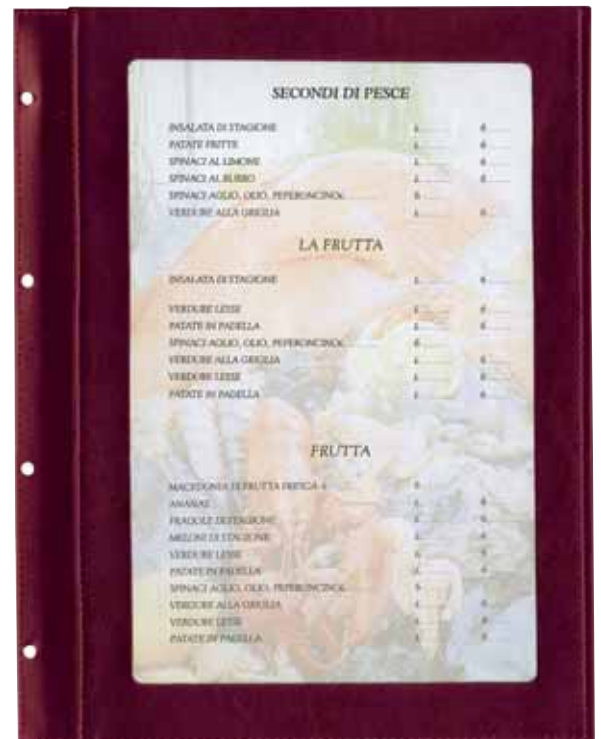
S/sepelle carta A4